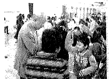
【一昨年の様子です】

東小ボランティア、スクールサポーター、ゲストティーチャー等、たくさんの方々にお世話になっています。自分たちがお世話になった皆さんに感謝の気持ちを伝えようという思いから、6年前に始まった「感謝の会」です。本年度も「ぜひ実施したい。」ということが、児童会で話し合われました。 2月1日(水) に行うことになりました。5・6年生が中心となって準備をしていきます。子どもたちが、どんな形で表すのか楽しみにしながら、支援していきたいと思えます。後日招待状をお届けします。ぜひご参加ください。